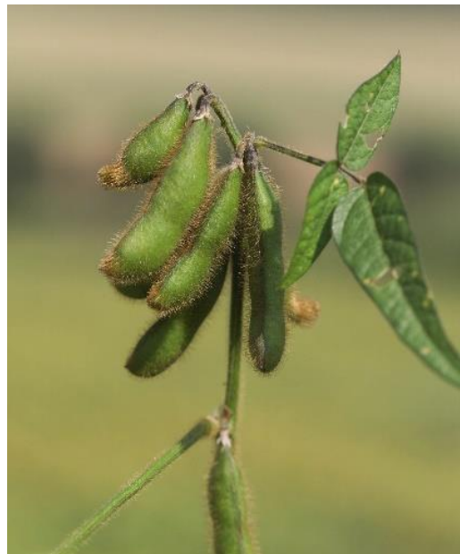
Sojabohnen am Feld.

Global betrachtet, verursacht vor allem die Änderung der Landnutzung – zum Beispiel die Umwandlung von Grünland oder Waldfläche in Ackerland – große Mengen an THG. [1] Anmerkung: Im internationalen Fachjargon wird für Landumwandlungen der Begriff Land use change (LUC) verwendet. Etwa 11% der globalen THG stammen aus Entwaldung. [2] Soja alleine ist für 31% der importierten Entwaldung in der EU verantwortlich. [3]